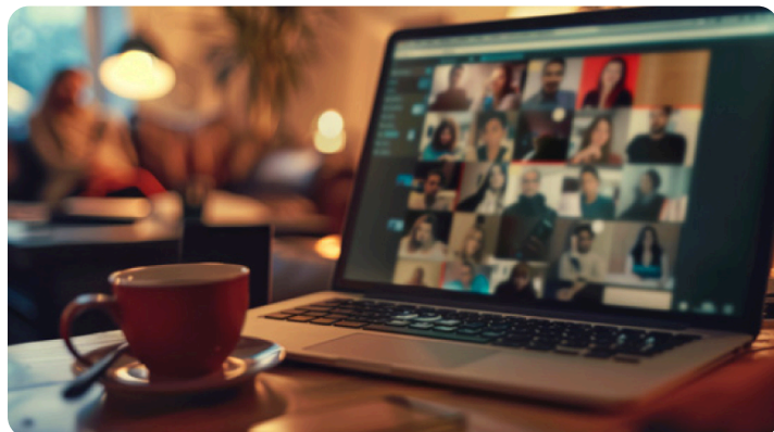
Groupes de parole